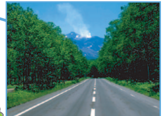
白樺街道 (北海道自然百選)