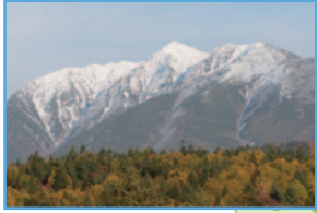
白金野鳥の森 (望むオオタテシ山)