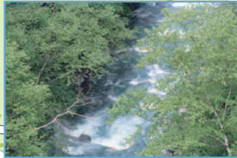
美瑛川 (俗名:ブルーリバー)