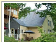
Tea & Cakes カモミール