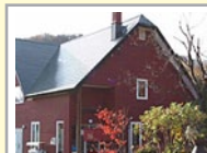
そうそう 染あとりえ草創